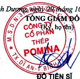
ĐỖ TIẾN SĨ